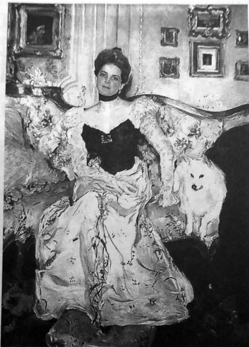
Портрет княгини Зинаиды Юсуповой. В.А. Серов. 1902 г.

сошелся. Роковой пасьянс сходилась у княгини Юсуповой 6 раз: накануне смерти ее отца, старшего сына, затем в декабре 1916-го накануне убийства Распутина, и вскоре в 1918-м — накануне гибели царской семьи. В следующий раз он сошелся через 10 лет на чужбине — перед смертью горячо любимого мужа, и, наконец, перед собственной кончиной.