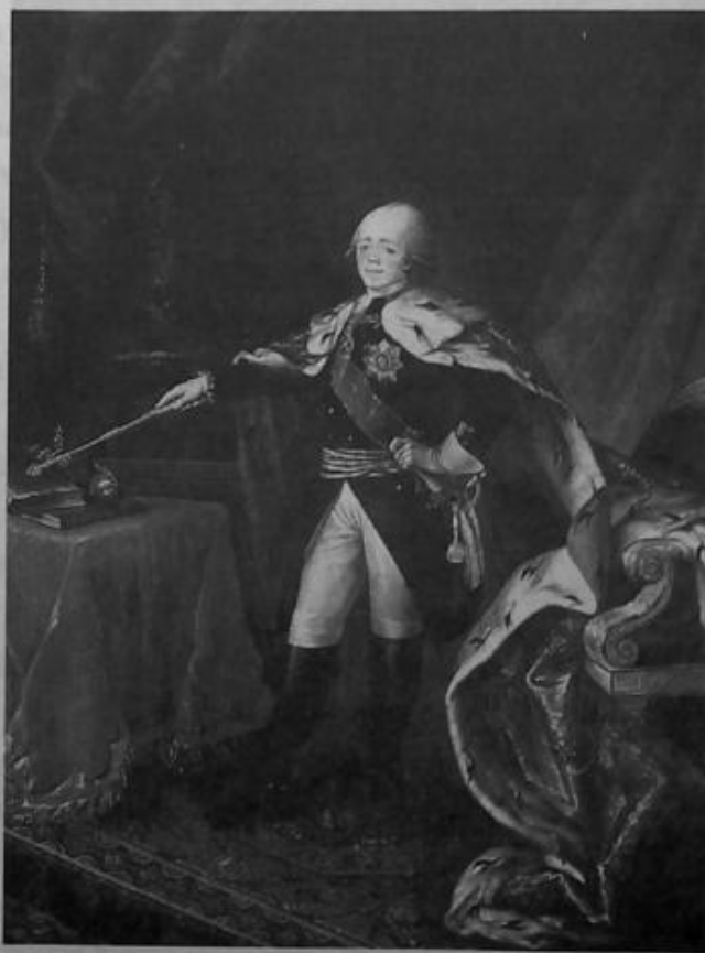
Портрет императора Павла I. Аргунов Н.И. 1797 г.

По слухам, сразу после вступления на престол старая ворожея нагадала Павлу I, что царствовать ему 4 года 4 месяца и 4 дня, что в точности исполнилось. Убийство Павла предсказала и знаменитая юродивая Ксения