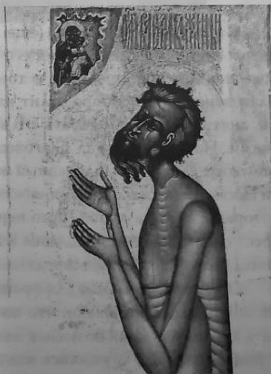
Святой блаженный Василий, Христа ради юродивый, Московский чудотворец

До сих пор до конца неизвестно, кто же построил храм. Согласно легенде, архитекторами были русские зодчие Барма и Постник, хотя некоторые историки склонны считать, что это был один человек — Иван Яковлевич Барма, которого прозвали Постником за