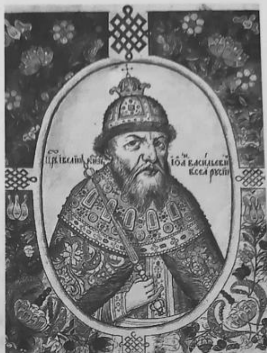
Царь и Великий Князь Иоанн Васильевич

В Смутное время знаменитая библиотека таинственно исчезает. Согласно легенде, когда Марина Мнишек с пышной свитой прибыла 3 мая 1606 года из Польши в Москву, чтобы выйти замуж за Ажедмитрия I, был в ее свите некий ученый муж, искавший таинственную Либерию. Честолюбивая и властная Марина Мнишек, процарствовавшая всего неделю, не была убита после смерти мужа только потому, что сначала не была узнана, а затем защищена боярами и отправлена к отцу. Вскоре «Маринка безбожница», как ее называли москвичи, попала в Тушинский лагерь, где тайно обвенчалась с Ажедмитрием II, признав в нем «спасшегося» мужа. Весной 1610 года, когда Тушинский лагерь Самозванца был разгромлен, Тушинский вор и Маринка бежали в Калугу.