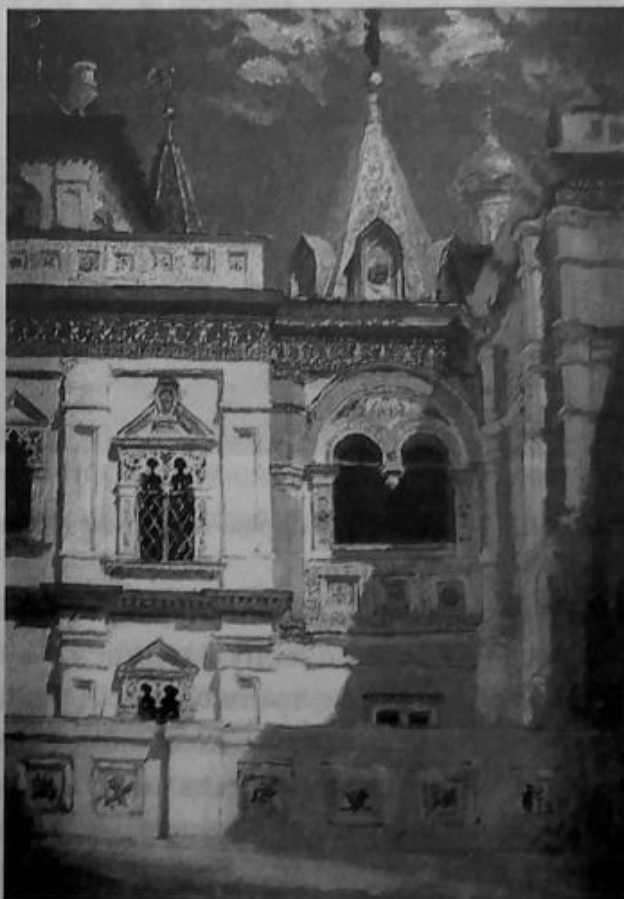
Теремной дворец. Наружный вид. В.Д. Polenov. 1877 г.

Вера в колдовство и чародейство была у русских монархов, правивших до XVIII века, настолько сильна, что