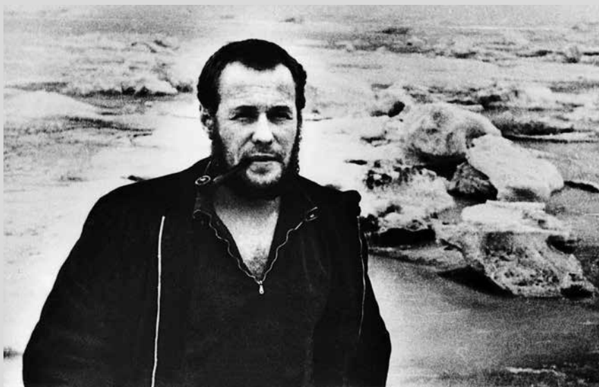
На берегу Ледовитого океана. 1964 г. (фото Б. Жутовского).

Фотографии из личного архива и фрагменты из произведений и писем Олега Куваева. Композиция Светланы Гринь