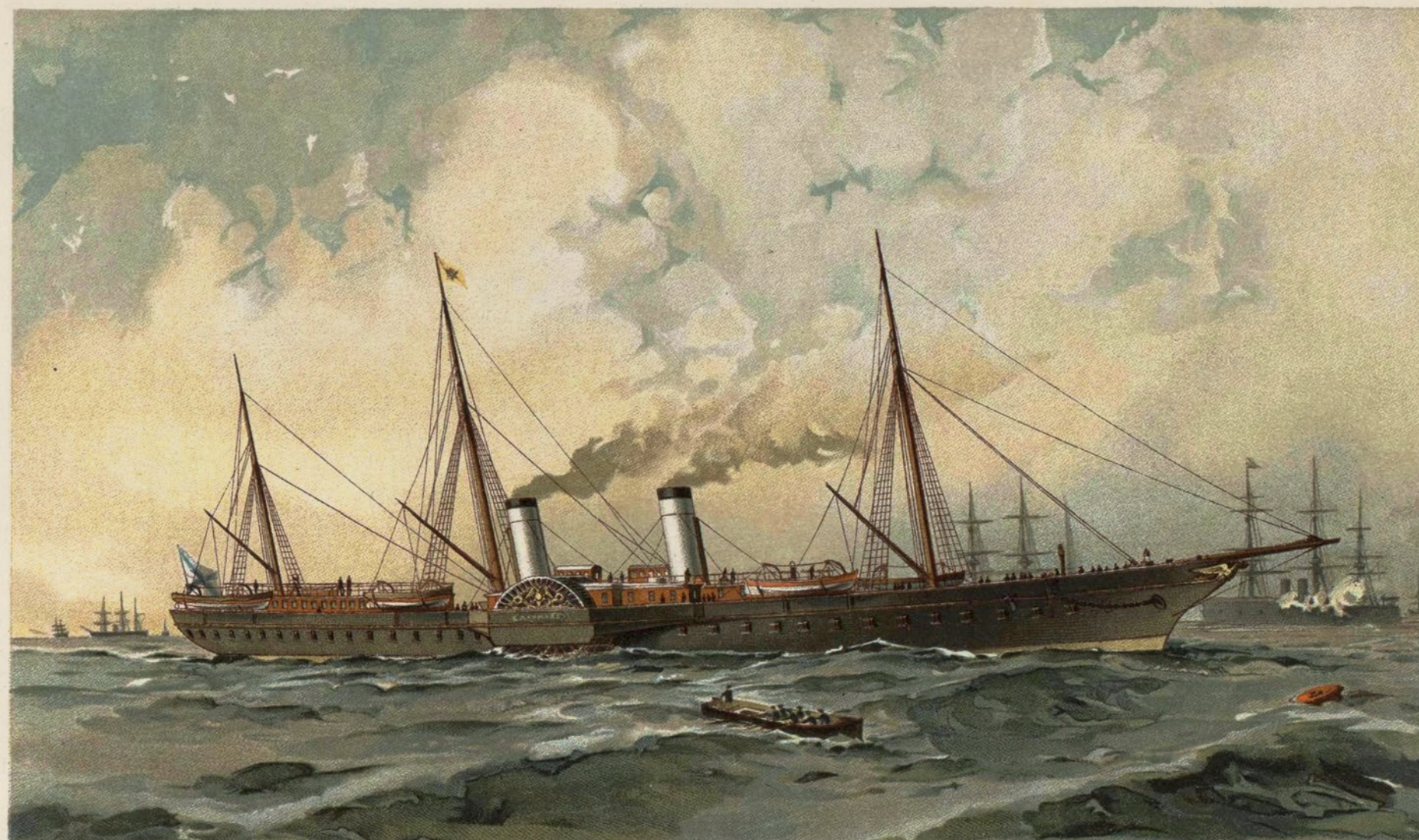
Императорская яхта „ДЕРЖАВА“ Yacht Impérial „DERJAVA“